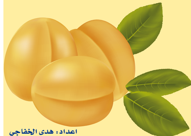
اعداد : هدى الخفاجي

ينصح بعدم أكله للأشخاص المصابين بعسر الهضم أو المصابين بالالتهابات الحادة في الأمعاء والمعدة وعدم شرب الماء البارد بعد أكله.