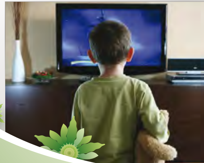
اعداد: هدى الزبيدي